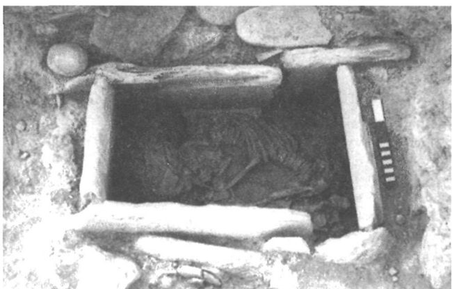
LÁM. IV. T39 de Gatas. Zona C.

El sector Norte de los cuadros centrales de la Zona C ofreció la estratigrafía de la terraza intermedia del área excavada hasta ahora en la Ladera Media II. Cuenta con niveles de ocupación de dos espacios estructurados de la última fase argárica, separados por un tabique. En la parte Este se documentó el enterramiento de una criatura de 3 a 5,5 meses de edad en urna de tipo 2 B3 (T40), con un ajuar compuesto por un brazaete de bronce. Estaba colocada en un hoyo revestido de piedras y con una tapa de cierre que sellaba el conjunto (Lám. III). En un momento anterior, el mismo sector estuvo ocupado por un área de consumo donde destaca la presencia de restos faunísticos y útiles de molienda. A este espacio corresponde una nueva tumba (T39) (Lám. IV), una cista calzada con abundantes útiles de molienda, que contenía los restos de un individuo de 14-16 años, probablemente masculino, cuyo único ajuar consiste en una concha perforada.