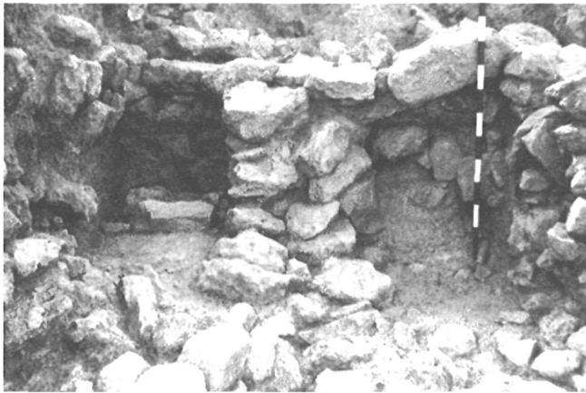
LÁM. VIII. Estructuras murarias de las estancias sudorientales de la fase GATAS IV. Zona C.

El final del asentamiento argárico (GATAS IV) está representado en el sector Este de la Zona C por dos unidades habitacionales con muros cabeceros y medianero de piedra y con superestructuras de láguenas (Lám. VIII). La unidad occidental fue destruida en la reestructuración arquitectónica postargárica, mientras que la unidad oriental se extiende al Este de la zona excavada. A una fase anterior, probablemente GATAS III, corresponde una nueva unidad arquitectónica delimitada por muros de piedra, que presenta un ábside en su parte septentrional. En este ábside se ha registrado una plataforma que configuró una superficie semicircular, una solución arquitectónica desconocida hasta ahora en Gatas (Lám. IX). Debajo de los niveles vinculados a esta habitación se registraron rellenos y restos de estructuras de las primeras fases argáricas sobre la roca, donde aparecieron decoraciones cerámicas de estilo campaniforme.