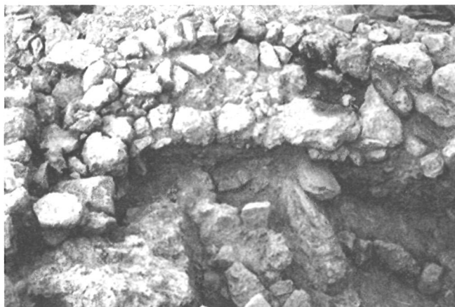
LÁM. IX. Plataforma absidal de la fase GATAS III. Zona C.

El final del asentamiento argárico (GATAS IV) está representado en el sector Este de la Zona C por dos unidades habitacionales con muros cabeceros y medianero de piedra y con superestructuras de láguenas (Lám. VIII). La unidad occidental fue destruida en la reestructuración arquitectónica postargárica, mientras que la unidad oriental se extiende al Este de la zona excavada. A una fase anterior, probablemente GATAS III, corresponde una nueva unidad arquitectónica delimitada por muros de piedra, que presenta un ábside en su parte septentrional. En este ábside se ha registrado una plataforma que configuró una superficie semicircular, una solución arquitectónica desconocida hasta ahora en Gatas (Lám. IX). Debajo de los niveles vinculados a esta habitación se registraron rellenos y restos de estructuras de las primeras fases argáricas sobre la roca, donde aparecieron decoraciones cerámicas de estilo campaniforme.