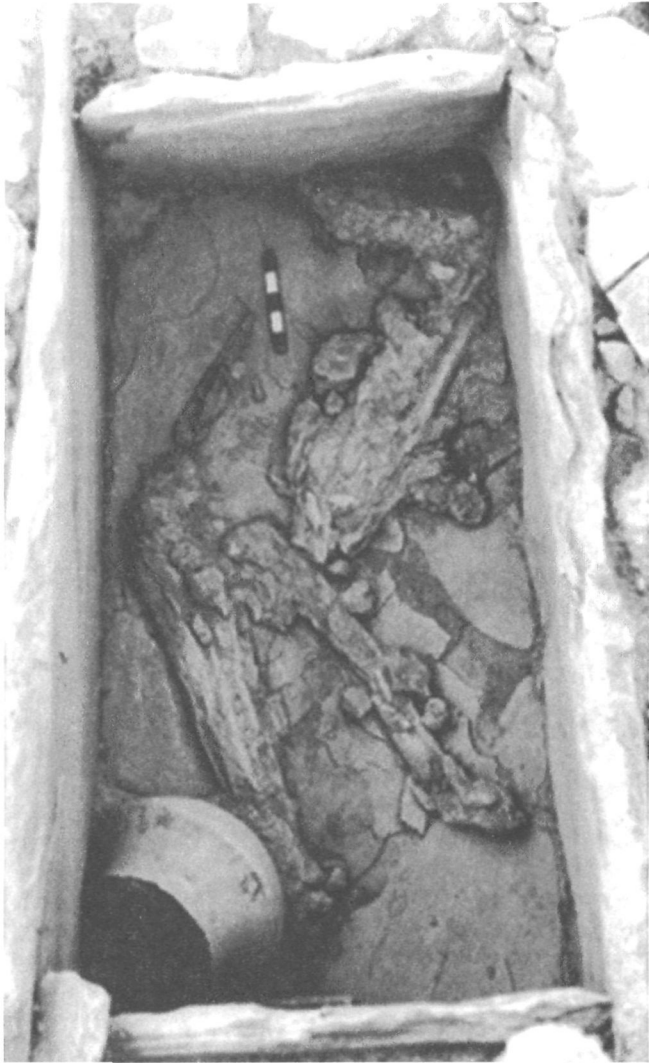
LÁM. VI. T42 de Gatas. Zona C.

de GATAS II en su parte occidental. Esta cabaña presentaba una planta curva, cuyos muros presentan un zócalo de piedra al que se adosaba un hogar.