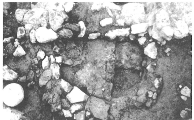
LÁM. II. Estructura de combustión de la fase GATAS IV. Zona C.

Debajo del piso del área de molienda citada, se registró la primera estructuración de la fase IV de Gatas. Se constató una estructura de combustión, que se levantó en el espacio central de una unidad estructural anterior, que tenía planta rectangular de 25/30 m 2 . La citada estructura de combustión presentaba un muro de planta circular y lechos con evidencia de una fuerte termoalteración (Lám. II).