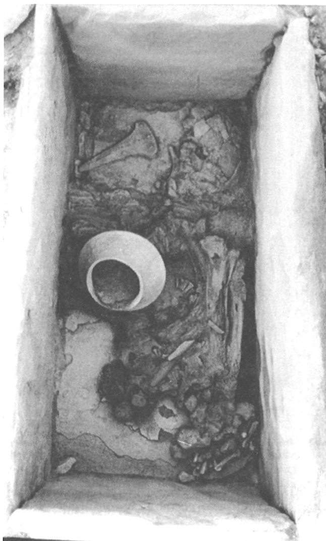
LÁM. V. T41 de Gatas. Zona C.

la bóveda de cubierta. Debajo del otro horno, al Oeste del anterior, se localizó la T41. Se trata de un enterramiento en cista, que contenía el esqueleto de un individuo masculino senil y un ajuar compuesto por una alabarda y un puñal de cobre y por una vasija cerámica de la forma 5 (Lám. V).