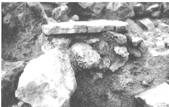
LÁM. III. T40 de Gatas. Zona C.

En la base del relleno citado pudo reconocerse un nivel sedimentario que ocupaba el espacio delimitado por un entalle de roca recortada para acondicionar un área útil y que se apoyaba igualmente en una superficie nivelada de roca natural. A la espera de las dataciones radiométricas, los restos artefactuales de este nivel permiten sugerir que corresponde a la ocupación preargárica (GATAS I).