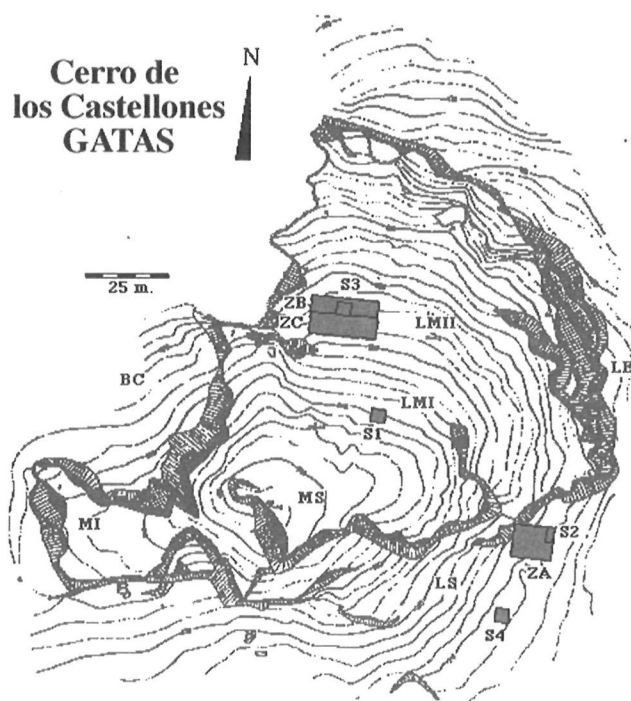
FIG. 1. Situación de las zonas objeto de las excavaciones sistemáticas en la Ladera Media II del cerro de Gatas. (Zonas B y C).

La fase III se inició durante la campaña de excavaciones de 1987 en la denominada Zona A, ubicada en la Ladera Sur del yacimiento. En este sector se localizaron una serie de depósitos argáricos y postargáricos y una estructura de planta curva (9). En la campaña de 1989 (10), el sector elegido para la realización de las excavaciones extensivas fue la Ladera Norte del yacimiento (Ladera Media II), donde se planteó la excavación en extensión de la Zona B. Para ello se tomaron como referencia las secciones del Sondeo 3, en el que se habían registrado varias estructuras habitacionales del segundo milenio antes de nuestra era y de época andalusí. Finalmente, en la campaña de 1991 (11), se procedió a abrir en extensión una nueva zona (Zona C), en el área situada inmediatamente al Sur de la Zona B (Fig. 1).