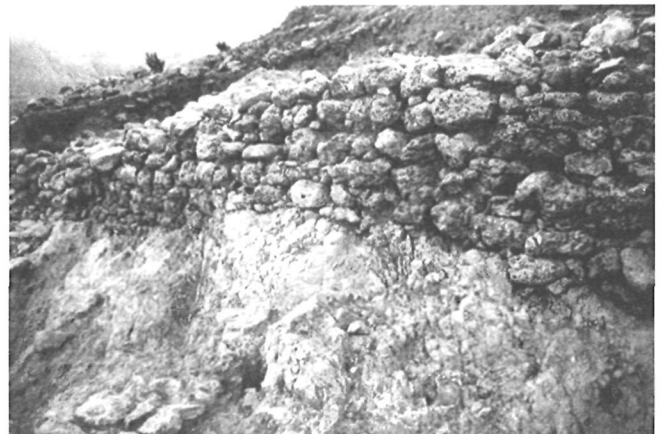
LÁM. VII. Muro cabecero de la unidad arquitectónica de la fase GATAS V. Zona C.

Sur el área excavada. Para ello ha sido necesario ampliar 1 m. la cuadrícula, de manera que dicho muro quedara incluido en el espacio de la excavación. Se trata de un muro cabecero de doble paramento, construido fundamentalmente con travertino (Lám. VII). Delimita un espacio de unos 60 m 2 , cuya orientación va de Sur/Sudoeste a Norte/Nordeste, girando hacia el Norte en su extremo oriental, mientras que por el Oeste sólo se conserva una hilada apoyada en la roca. El cierre distal de esta unidad arquitectónica no se ha conservado debido a la erosión. Sin embargo, en su interior se registraron diversos compartimentos, con muros de piedra y de tapial, correspondientes a varias reestructuraciones del espacio en el marco de la fase GATAS V, el primer asentamiento postargárico del cerro. El cambio en la organización del espacio de la Ladera Media II de Gatas que representa esta unidad coincide con el declive de las prácticas funerarias argáricas y con otras transformaciones vinculadas al final del grupo argárico c. 1500 cal ANE.