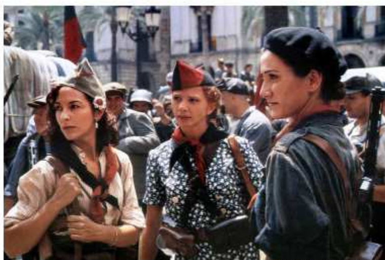
Libertària (dir. Vicente Aranda, 1996)

Barcelona, UAB Casa Convalescència 3 al 7 de juliol de 2017