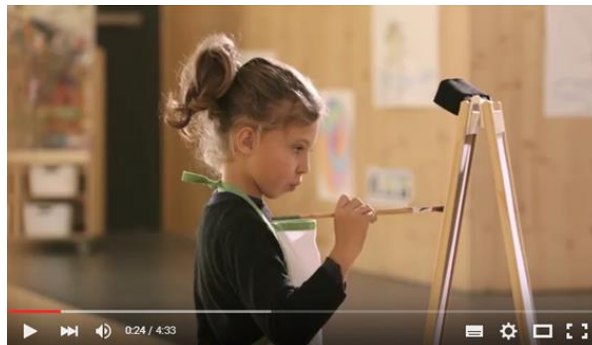
No Penso Callar

El mestre o mestra ha de destacar les següents idees clau: