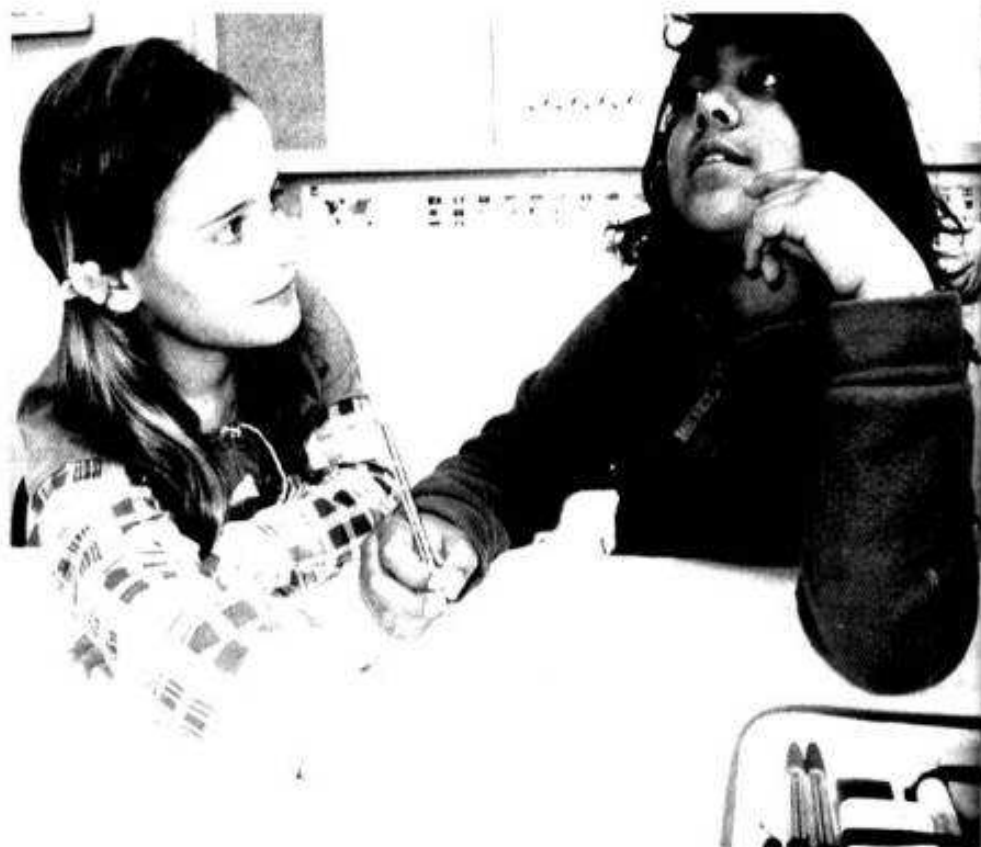
La tutora explica y corrige los ejercicios, siempre desde la proximidad.

Una experiencia de tutoría entre iguales en tercero de Primaria utiliza la cooperación para convertir las interacciones personales en oportunidades de aprendizaje. La formación del alumnado y la asignación de roles alternos de tutores y tutorados permite comprender los contenidos y mejorar la competencia lectora y escrita.