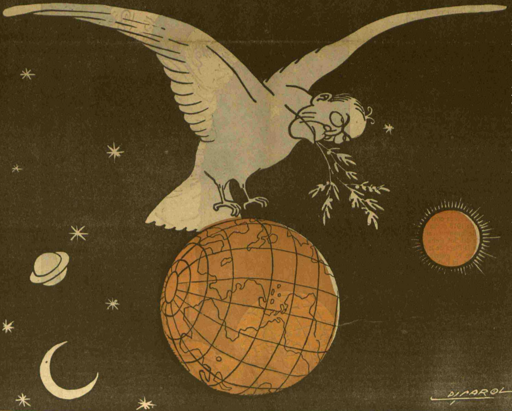
Imatge portada: La Campana de Gràcia, octubre de 1918.

Universitat de Girona Sala de Juntes, Facultat de Lletres 2 i 3 de novembre de 2023