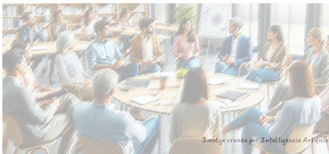
Imatge creada per Intel·ligència Artificial