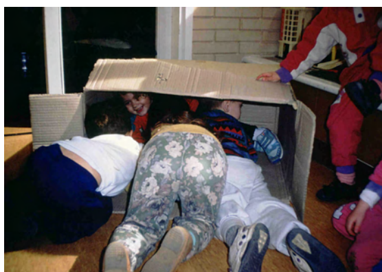
¿Tres? ¿O más?