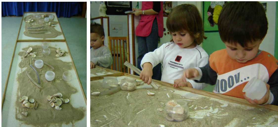
Los tubos marcan caminos en la arena. Mi bote ya está lleno de conchas

arena, como a elementos a coleccionar dentro del contenedor o incluso haciendo caminos y recorridos en la arena.