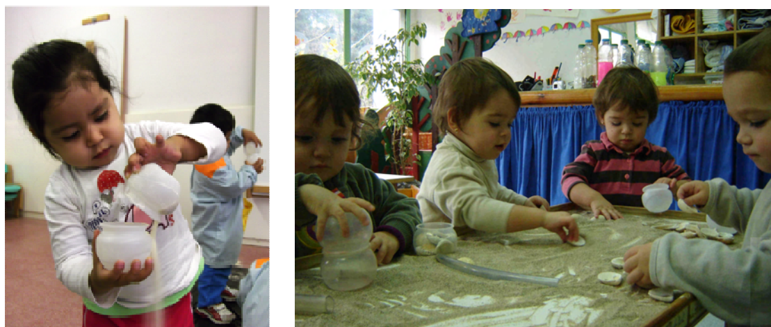
El trasvase no es fácil. Tienen la obertura pequeña. Encajan bien los botes pero no se cierra. Dedos, manos, conchas y tubos hacen caminos y recorridos en la arena...