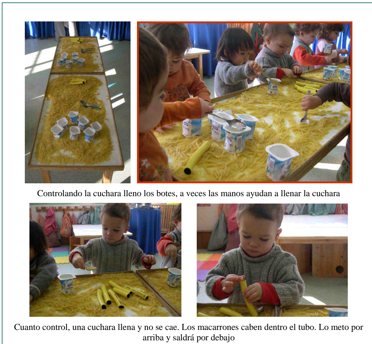
Controlando la cuchara lleno los botes, a veces las manos ayudan a llenar la cuchara

Esta selección provoca que los trasvases se centren tanto en los fideos, como en los macarrones. Los trasvases se realizan principalmente con la cuchara, aunque los macarrones a menudo se usan también como elementos discretos, tomándolos uno a uno para colocarlos en el recipiente o introduciéndolos a través del tubo con mucho cuidado y perfeccionando así la pinza, etc.