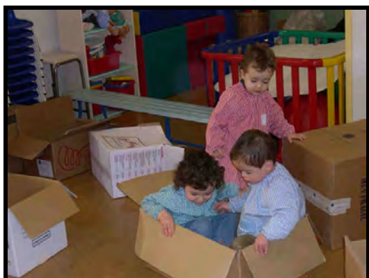
¿Caben dos niños dentro?

Al interactuar con las distintas cajas descubren de forma vivencial algunas nociones topológicas: Abierto y cerrado, dentro y fuera, entrar y salir. Aspectos vinculados a la forma: caras planas, caras curvas, se apila, rueda, etc. aspectos relacionados con la capacidad de niños: cabe uno, dos, tres, muchos niños, no cabe ninguno, etc.