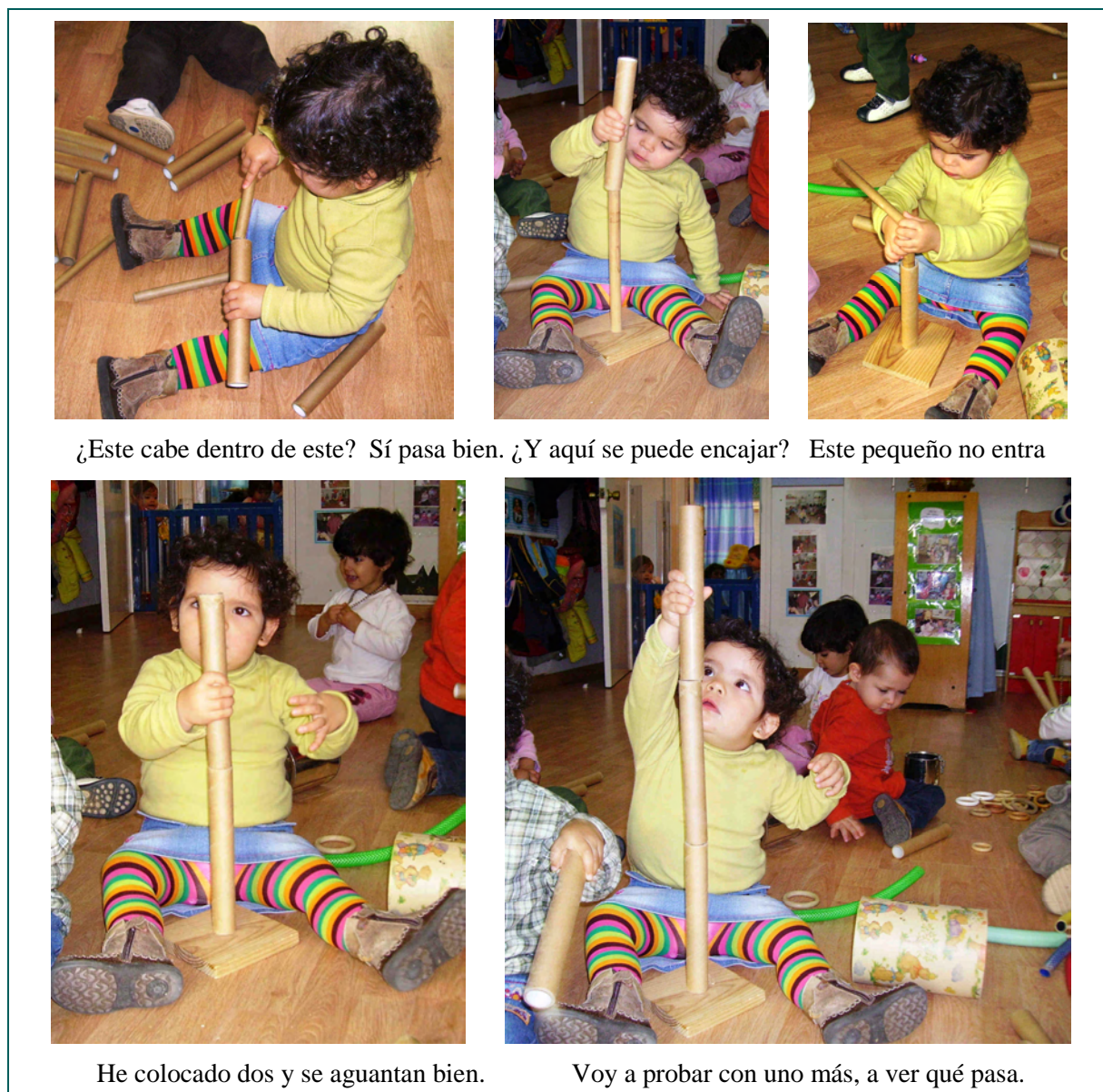
Figura 2. Secuencia de imágenes de una sesión de juego heurístico de mi fondo documental