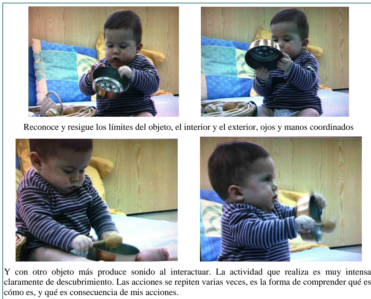
Figura 1. Secuencia comentada de imágenes extraídas del video en Majem y Òdena (2007)