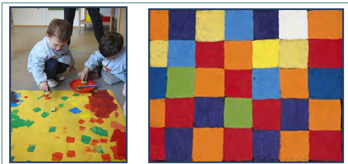
Figura 7. Imágenes de una sesión de estampación de cuadrados vinculado a la observación de la obra de Paul Klee