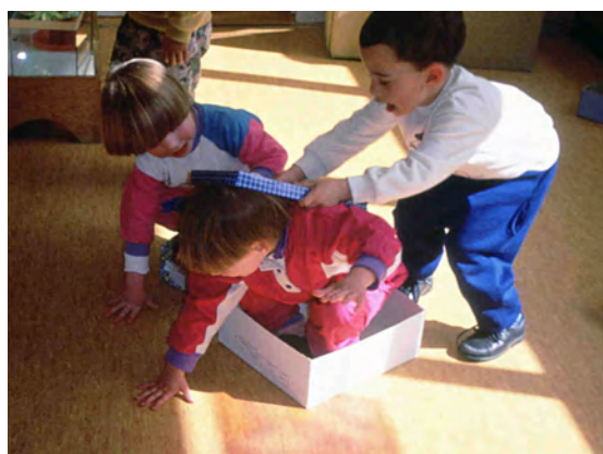
¿Se puede tapar?