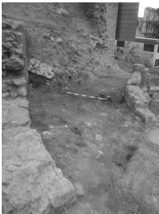
Fig. 2: Nivell de destrucció de l'exedra (Foto J. Morera).