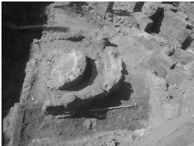
Fig. 1. Exedra del c) Vapor.