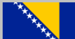
Bosnia y Herzegovina