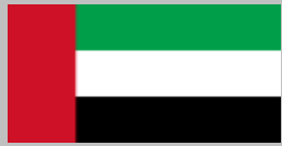
Emiratos Árabes Unidos