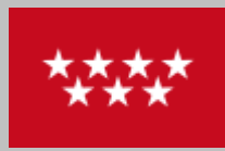
Comunidad de Madrid