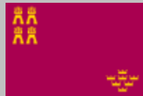
Región de Murcia