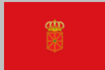
Comunidad Foral de Navarra