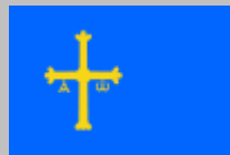
Principado de Asturias